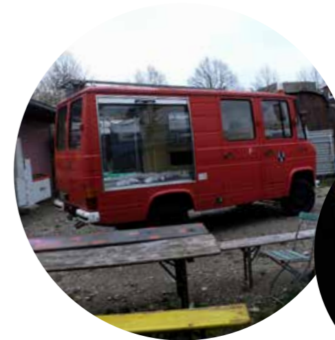
15.11.19 Die Schmuckkünstlerin Mirei Takeuchi stellt ihr mobile Ausstellung »Wellental III«, die normalerweise im Lehel zu sehen ist, auf dem Platz vor.