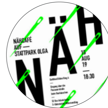
15.8.19 NÄH – Café auf OLGA. Nadel und Faden, auch Knöpfe, Borten, Puschis, Aufnäher, Bling Bling und Blong Blong oder einfach Löcher in euren Socken unter fachkundiger Anleitung.