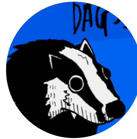
8.8.19 Konzert mit dags! auf OLGA. Indie emo rock, verspielt, verzockt, verträumt und weitere Adjektive mit ver-...