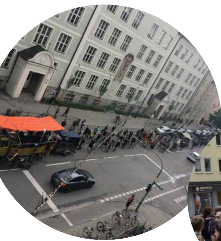
3.8.19 Freiraum Konvoi - MÜNchEn MÖchtE GerN frElrAUm! - mit dept. of volxvergnuegen, Stattpark Olga, Hin und Weg, Kafe Kult e.V., Wohnprojekt Ligsalz8, DoniHof, Siebdruck-Schmitz & WerkBox3 ev, Mittagstopf, Kafe Marat, Karl e.V., Black Rat Collective, Wohnprojektinitiative El Caracol, Freiraum e.V. Dachau, Rad und Tat e.V., Klimacamp, muccc