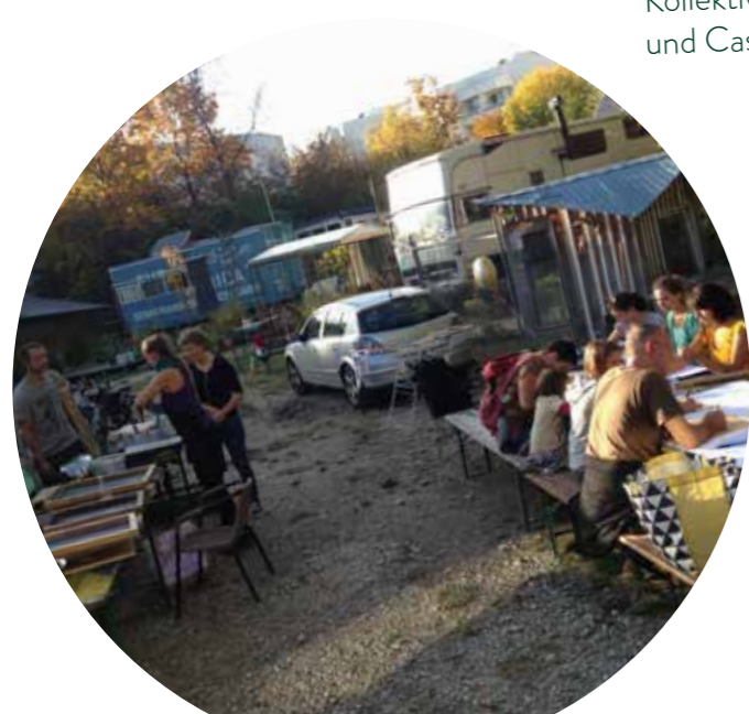
13.10.19 Siebdruck Workshop. Selber bedrucken von T-Shirts, Taschen, oder Papier nach eigenen Ideen oder Vorlagen.